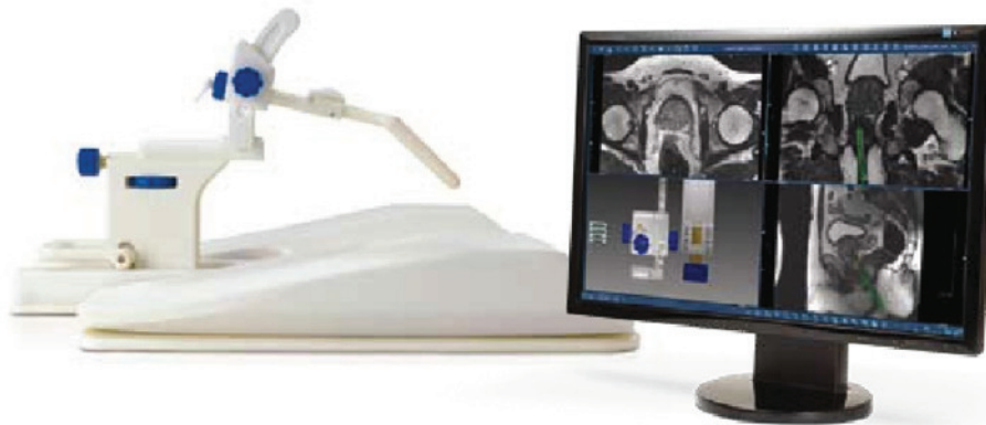
Interventionseinheit DynaTRIM mit DynaCAD Planungssoftware

Eine Meta-Studie von Lawrentschuk et. al. (BJU Int. 2009 Mar;103(6):730-3. Epub 2009 Jan 14. „The role of magnetic resonance imaging in targeting prostate cancer in patients with previous negative biopsies and elevated prostate-specific antigen levels.“ ( http://www.medicalnewstoday.com/articles/153702.php ) kommt zu dem Schluss: